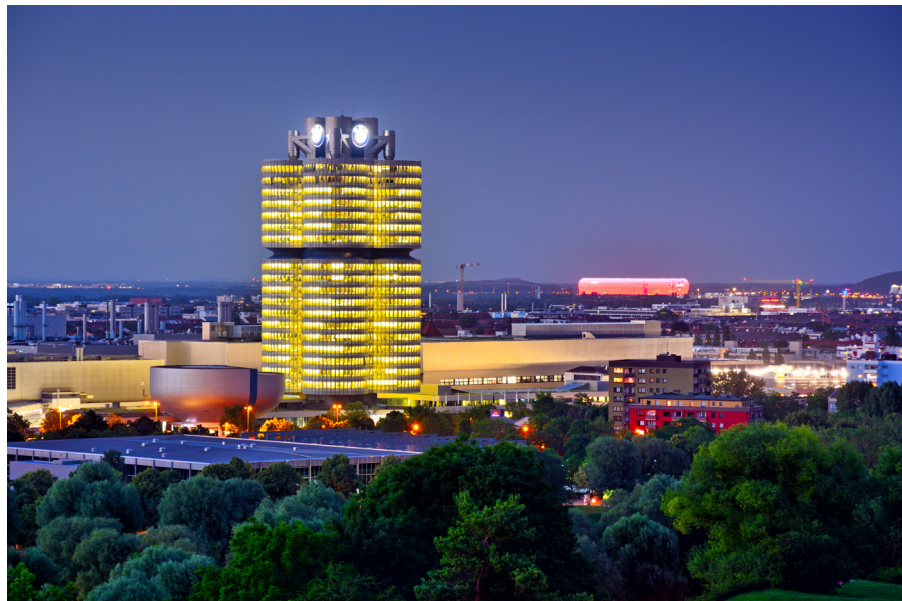
München bei Nacht mit Hochhausturm und Hauptsitz von BMW mit Blick auf die Allianz Arena