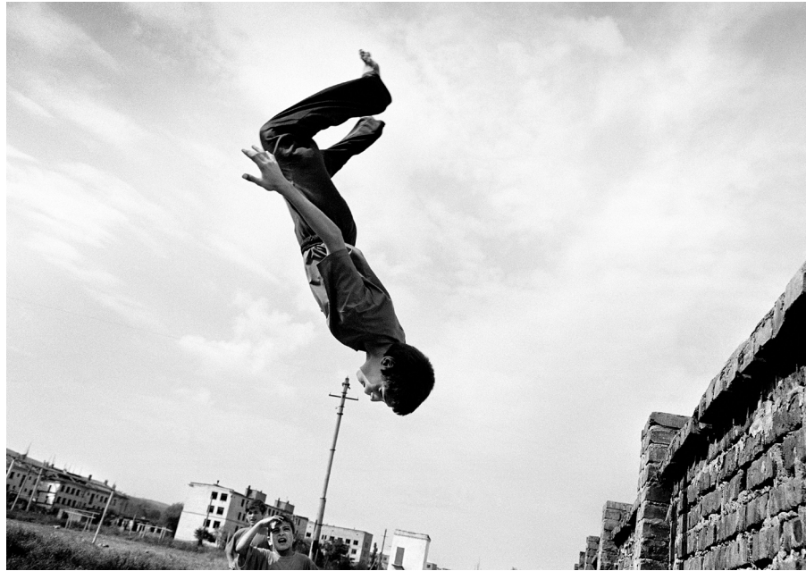
Boys playing, Tschetschenien 2004, Foto: Jan Grarup, madebygrarup.com