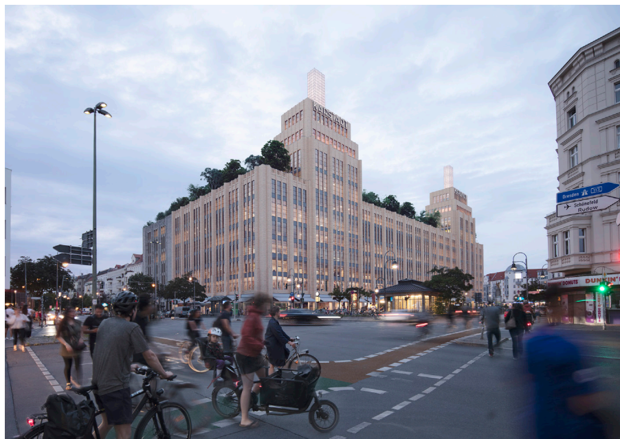
Visualisierung: Karstadt am Hermannplatz. SIGNA, David Chipperfield Architects. Berlin, in Planung. © SIGNA, David Chipperfield Architects

- Moderation: Nadin Heinich, plan A, Jan Friedrich, Bauwelt