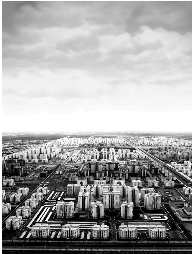
Kilamba New City, Luanda, Angola